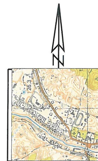
SZKIC ORIENTACYJNY skala 1 : 25000

Niniejsza mapa wykonana została bez ustalania obciążeń służebnościami gruntowymi ujawnionymi w księgach wieczystych.